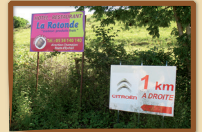
Ex. de pré-enseignes jusqu'ici dérogatoires, qui ne le seront plus en juillet 2015.

Ces activités seront alors signalées dans les conditions définies par les règlements relatifs à la sécurité routière (par des panneaux de signalisation d'intérêt local).