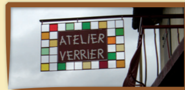
Exemple d'enseigne préconisé en fer forgé et verre