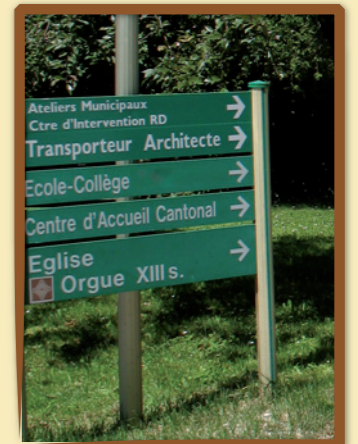
Exemple de micro-signalétique en Vicdessos

Le RIS est un équipement de signalisation routière d'indication implanté sur un lieu du domaine public offrant des possibilités de stationnement. Il est composé d'une cartographie avec voiries, équipements, activités et services. Les informations à caractère commercial doivent y être gratuites, informatives et exhaustives.