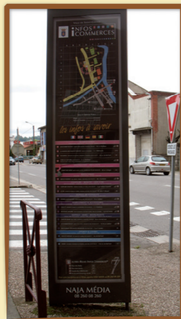
Exemple d'une sucette à Saint-Girons. En l'absence de Règlement local de publicité, la publicité au verso y est interdite.

Toute commune est obligée de prévoir un espace d'expression libre pour les habitants, les associations, les manifestations culturelles et sportives... Les surfaces minimales de ces dispositifs sont de 4 m 2 pour les communes de moins de 2000 habitants (141 communes dans le PNR) et de 2 m 2 supplémentaires par tranche de 2000 habitants pour les autres communes (12 m 2 pour Saint-Girons).