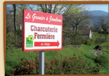
Ex. de pré-enseigne autorisée dite dérogatoire au titre de produits du terroir