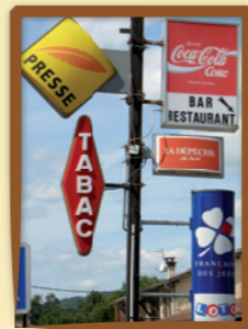
Cas problématique du nombre d'enseignes pour les bars-tabacs

Dans le PNR, l'installation d'une enseigne est soumise à autorisation du Maire, après avis de l'Architecte des Bâtiments de France.