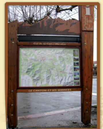
Exemple de relais information service